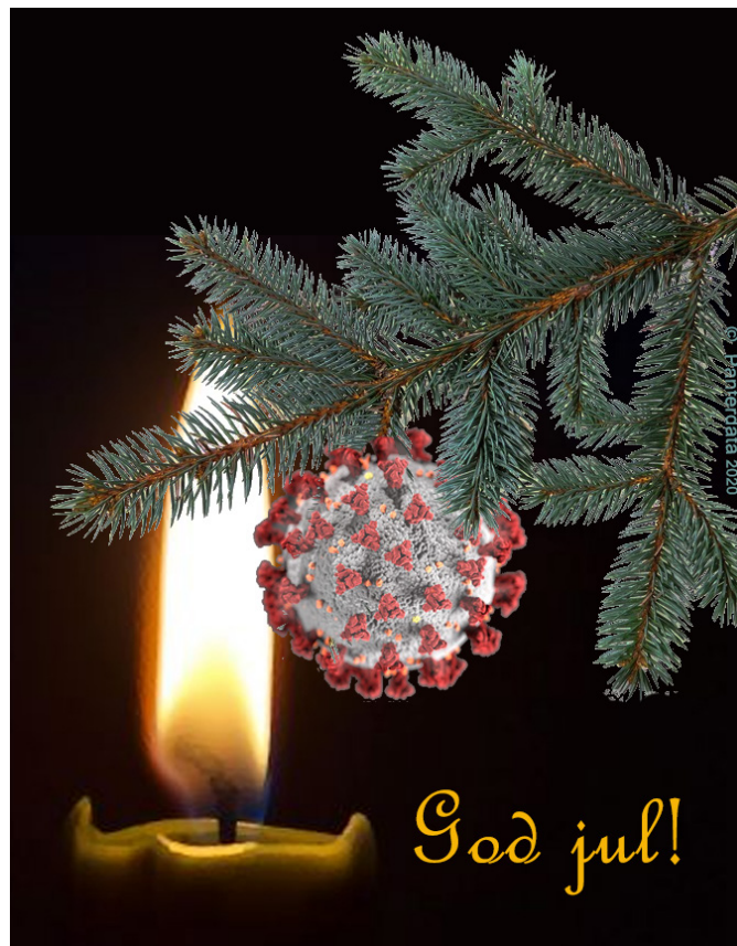
I år har vi en annorlunda julstämning.

Enligt stadgarna skall föreningen utgöra ett band mellan äldre och yngre generationer vid Västgöta Nation i Uppsala och stödja Nationen i dess verksamhet samt säkerställa utgivningen av tidskriften Vestrogothica. Föreningen är att betrakta som en alumnorganisation. Styrelsens ambition är att långsiktigt stärka föreningens ekonomiska situation. Och en betydelsefull del i detta är att vi har många medlemmar. Vi behöver verkligen fylla på kassan nu, så glöm inte betala!