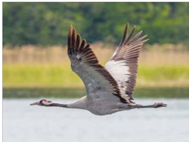
Trana anländer Vaholm.

Tranparen håller ihop livet ut. Varje vår i april-maj lägger honan två ägg som ruvas cirka en månad, växelvis av båda. Efter nio-tio veckor är kan ungarna flyga. I september-oktober flyttar tranorna till Sydeuropa och Nordafrika., de barnlösa flyger iväg först och de med ungar kommer senare.