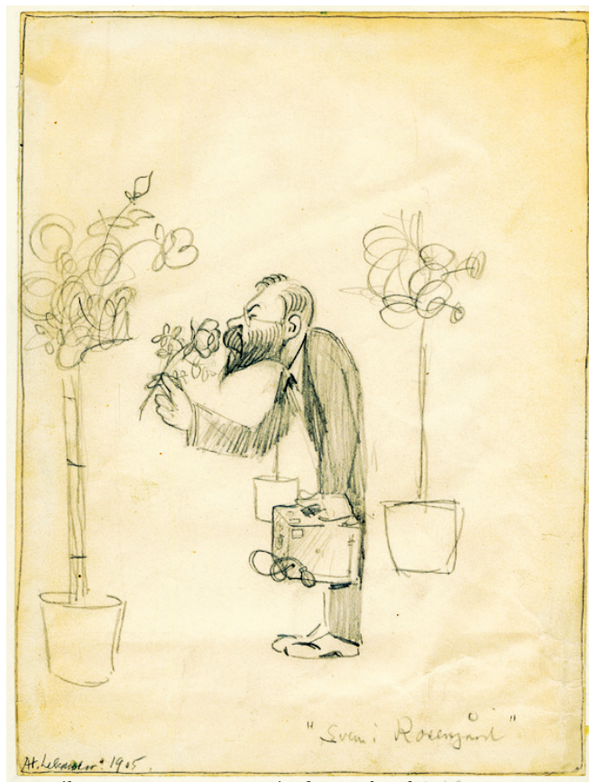
Karikatur av Sven Lampa ritad av Lekander 1905.

Han skrevs in på Västgöta Nation 1889 och blev Nationens bibliotekarie. På den tiden fanns landsmålsföreningar vid Västgöta med flera nationer, där medlemmarna åkte till sina respektive hembygder och dokumenterade folkmål, folkdiktning, seder och bruk. Sven Lampa deltog ivrigt och skrev ett antal böcker om folkliv i Västergötland, Uppland och Härjedalen. 1903 disputerade han med avhandlingen Studier i svensk metrik (versmått) och blev docent i svensk folklivsforskning 1909. Han blev då den förste i vårt land som fick en akademisk titel i folklivsforskning, det ämne som idag heter etnologi, Han var sekretera-