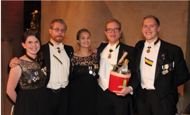
De finska vännerna från Nylands Nation uppvaktade liksom Västgöta Nation i Lund som förärade jubilarer en 375 år gammal karta